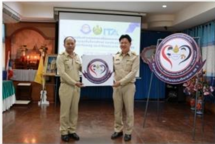
-การประชุมคณะกรรมการเพื่อวิเคราะห์ความเสี่ยงการทุจริตและบริหารจัดการความเสี่ยง การทุจริตประจำปีงบประมาณ พ.ศ.2566