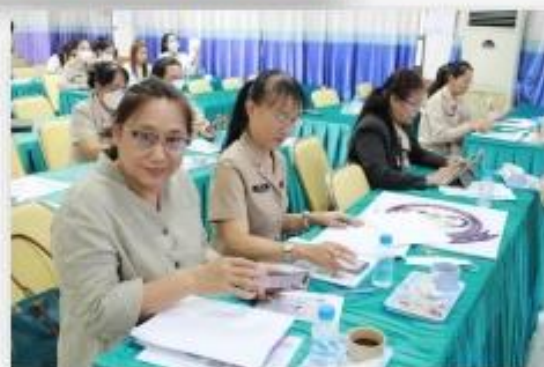
-การจัดทำสื่อประชาสัมพันธ์สร้างการรับรู้เพื่อต้านทุจริต